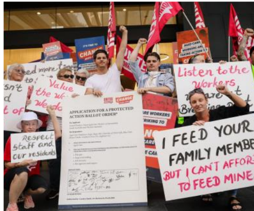
Maart 2022

Al jaren vechten de collega's in de ouderenzorg in Australië voor hogere lonen en betere arbeidsomstandigheden. In 2022 werden er acties gevoerd. Er werken meer dan 200.000 mensen in de ouderenzorg, zowel in instellingen als in de thuiszorg. Uiteindelijk werd er een commissie ingesteld die moest onderzoeken hoe veel de lonen achter liepen. De commissie (Fair Work Commission) was het eens met de stelling van de vakbonden dat de lonen zo laag waren